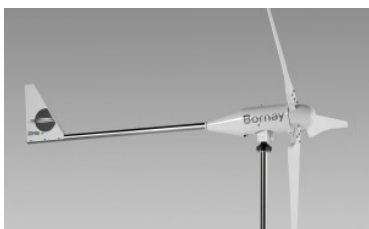
Aerogenerador minieólica Bornay Wind 25.3+