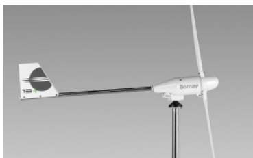
Aerogenerador minieólica Bornay Wind 13+

Los Aerogeneradores Wind + son el resultado de más de 50 años de experiencia en el sector de la minieólica, en el cual Bornay ha trabajado duro, innovando, para obtener un resultado hasta ahora desconocido.