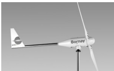
Aerogenerador minieólica Bornay Wind 25.2+