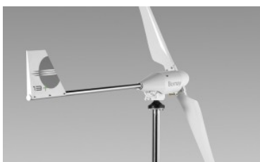
Aerogenerador minieólica Bornay Wind 13+