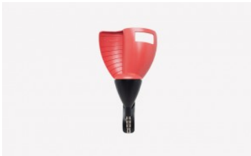
Anemómetro Vaavud Sleipnir