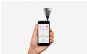
Anemómetro Vaavud Sleipnir