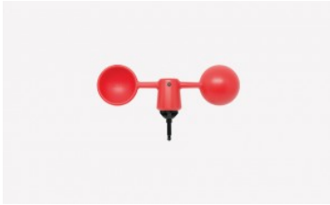
Anemómetro Vaavud Mjólnir