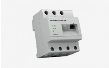
SMA Energy Meter

Solución de medición para una gestión inteligente de la energía en plantas fotovoltaicas con equipos de SMA.