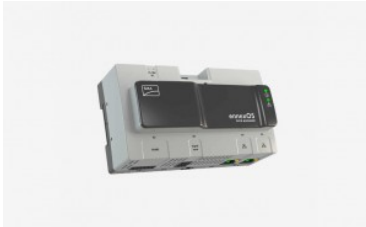
SMA Data Manager M

Esta potente solución de medición garantiza una gestión inteligente de la energía en plantas fotovoltaicas con equipos de SMA. El SMA Energy Meter determina los valores de medición eléctricos de forma precisa para cada conductor de fase y en forma de valores saldados, y los comunica a través de ethernet en la red local. Esto permite transmitir todos los datos de inyección a red y consumo de red, e incluso los relativos a la generación de energía fotovoltaica de otros inversores fotovoltaicos, con una precisión y frecuencia elevadas a los sistemas de SMA.