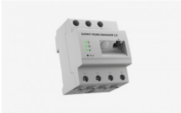
SMA Home Manager