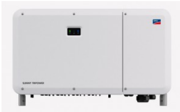
Sunny Tripower CORE2

Diseño flexible y rendimientos máximos gracias a sus características integradas