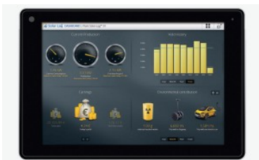
Sistema de Monitorización SolarLog