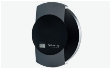
Sistema de Monitorización y Rele de Vertido 0, SolarLog 300