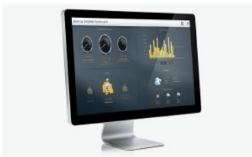
Sistema de Monitorización SolarLog

El sistema de monitorización de bajo coste para controlar su rendimiento y fallos en plantas fotovoltaicas con una potencia máxima de hasta 15 kWp. Incluye función de alarma y gráfica de evaluación en su PC.