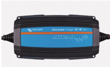
Cargador de baterías Victron Energy BluePower