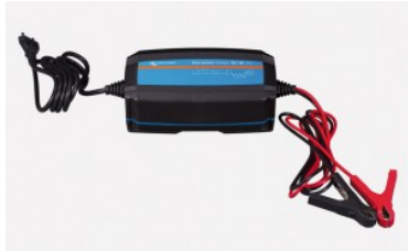
Cargador de baterías Victron Energy BluePower