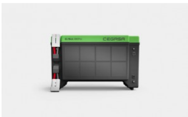
Cegasa Ebick 280 pro