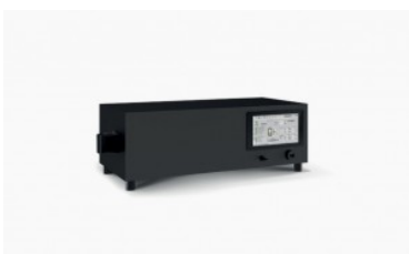
Cegasa Ebick 280 pro control