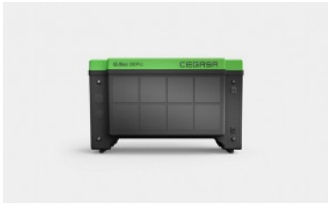
Cegasa Ebick 280 pro

Sistema modular plug & play de alta densidad de energía para aplicaciones desde los 80 kWh hasta los 4 MWh.