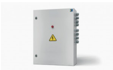
Cegasa Ebick 280 pro protec

E/Bick 280Pro es la solución de Litio-LFP más versátil para el almacenamiento de energía. El sistema idóneo para aplicaciones comerciales e industriales ongrid y offgrid desde los 80 kWh hasta los 4 MWh.