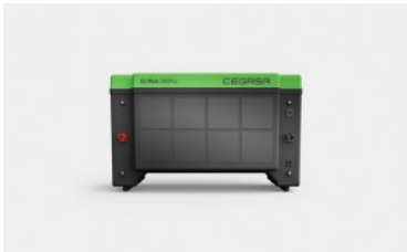
Cegasa Ebick 280 pro