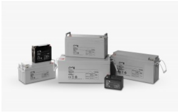
Baterías monobloc Me energy