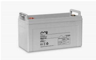
Batería monobloc me 12/120