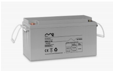
Batería monobloc me 12/150