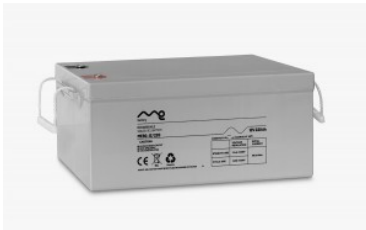
Batería monobloc me 12/220