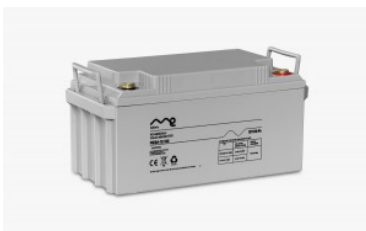
Batería monobloc me 12/80