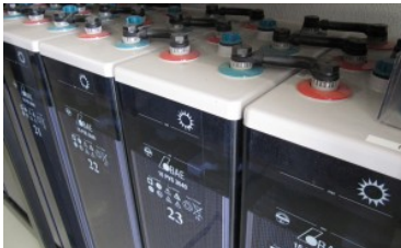
Batería Estacionaria BAE 16 PVS 3040