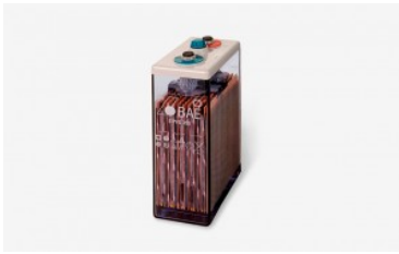
Batería Estacionaria BAE PVS