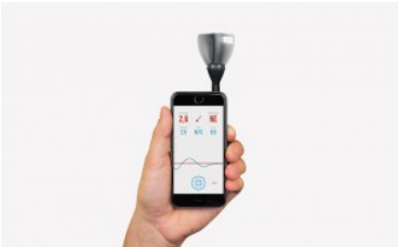
Anemómetro Vaavud Sleipnir