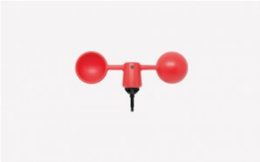
Anemómetro Vaavud Mjólnir