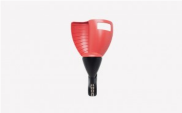
Anemómetro Vaavud Sleipnir