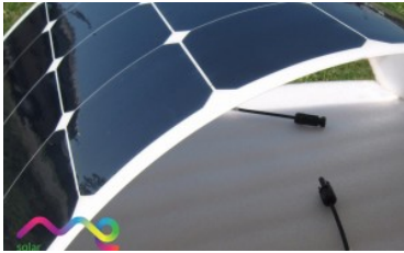
Panel Solar Flexible Me Solar