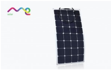
Panel Solar Flexible Me Solar