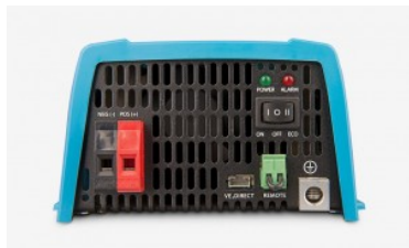
Inversor Phoenix VE.Direct