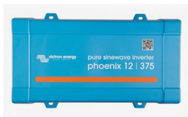
Inversor Phoenix VE.Direct