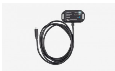
VE.Direct Bluetooth dongle

La nueva gama de inversores Victron Energy Phoenix VE.Direct vienen a sustituir los bien conocidos Phoenix, añadiendo nuevas funcionalidades y versatilidades al equipo: