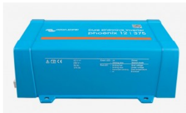
Inversor Victron Energy Phoenix VE.Direct