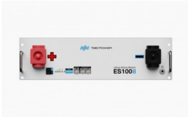
TBB Power ES100

ES100 es una batería LiFePo4 modular, bajo formato rack, a una tensión nominal de 48V y una capacidad de 105Ah, 5040 Wh útiles de almacenamiento diseñada para trabajar con profundidades de descarga de hasta el 90% y una vida útil de más de 6000 ciclos.