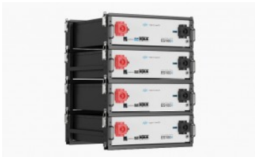
Bornay / TBB Power ES100