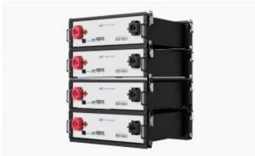
Bornay / TBB Power ES100