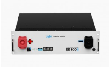
Bornay / TBB Power ES100