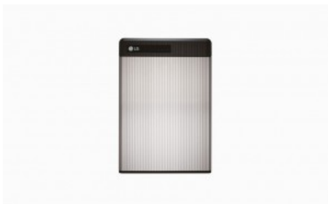
Bateria LG RESU6.5