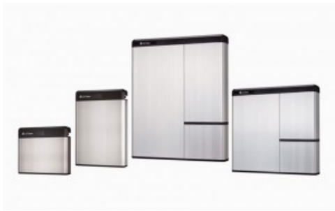
Baterías LG RESU

Las baterías de Litio para almacenamiento de energía LG Chem RESU pueden almacenar el exceso de energía generada por su tejado solar fotovoltaico para su uso cuando se necesite, e incrementar de ese modo su porcentaje de autoconsumo.