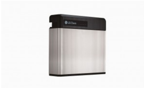
Bateria LG RESU3.3