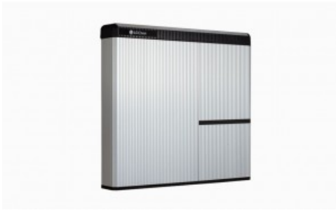
Bateria LG RESU7H

Una batería o sistema de almacenamiento de energía , puede almacenar el exceso de energía generado por los paneles de sus sistemas solar fotovoltaico para su uso posterior cuando se necesite. A la puesta del sol, cuando la demanda de energía es mayor, o picos puntuales, usted puede utilizar la energía almacenada en su batería para suministrar la energía necesaria sin ningún coste extra, a la vez que la batería le ayuda a incrementar su ratio de autoconsumo hasta el punto de incrementar al máximo su independencia energética.