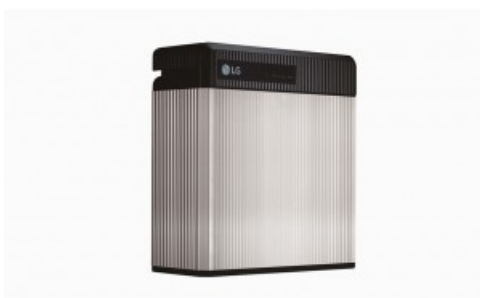
Bateria LG RESU10