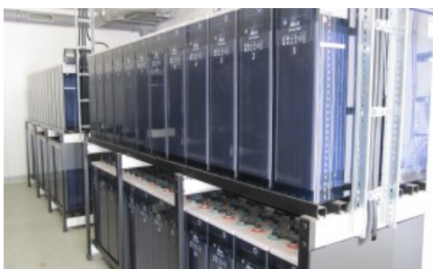
Batería Estacionaria BAE 16 PVS 3040

Las baterías estacionarias BAE SECURA PVS con un bajo mantenimiento son usadas para almacenar energía en instalaciones de energías renovables de tamaño medio y grande.