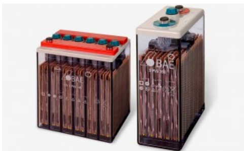
Baterías Estacionarias BAE PVS