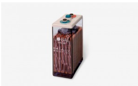
Batería Estacionaria BAE PVS