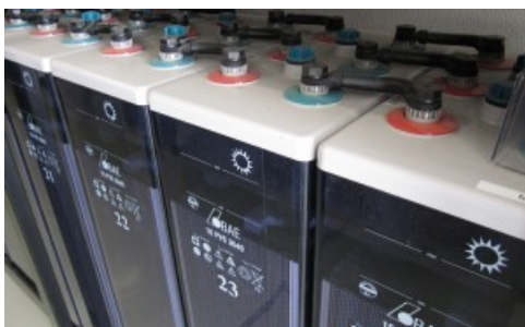
Batería Estacionaria BAE 16 PVS 3040